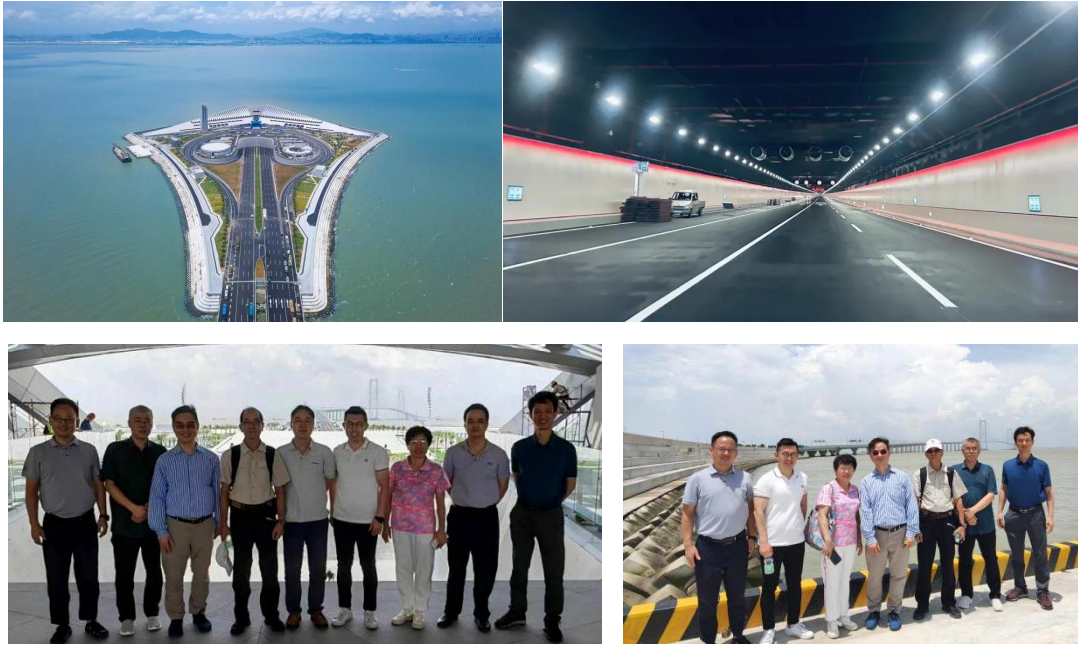
深中大桥上，工程师们仔细了解大桥的悬索体系结构。