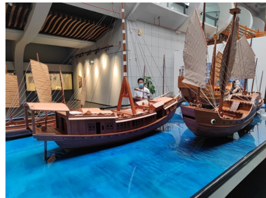
图 5-6 打捞“南海 I 号”模型展示

党员同志听着线上语音讲解，跟随解说参观了扬帆、沉没、探秘、出水、价值、遗珍、成果七大主题展区。虽然出于文物保护的原因，南海 I 号的发掘现场并未完全展示出来，但是展厅也陈列展示了数十种珍贵文物，其中包括了异域风情的饰品，朴素典雅的瓷器，极其罕见的宋代漆器等等。党员同志都被当时的高超工艺和文化魅力所倾倒，领略到了古代海上丝路恢宏灿烂的文明。