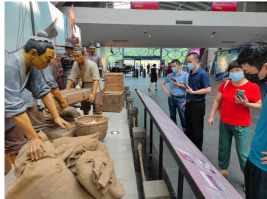
图 3-4 广东海上丝绸之路博物馆展厅参观学习